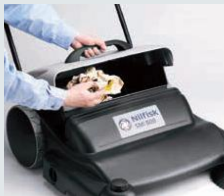
Der Schmutzbehälter kann aufgestellt werden, dies ermöglicht das Entleeren von Abfalleimern und Entsorgen von größeren Gegenständen direkt in den Behälter.