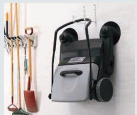
Die intelligente Konstruktion erlaubt eine senkrechte, sogar hängende Lagerung der Maschine, da der Schmutzbehälter durch den umgeklappten Handgriff fixiert wird.