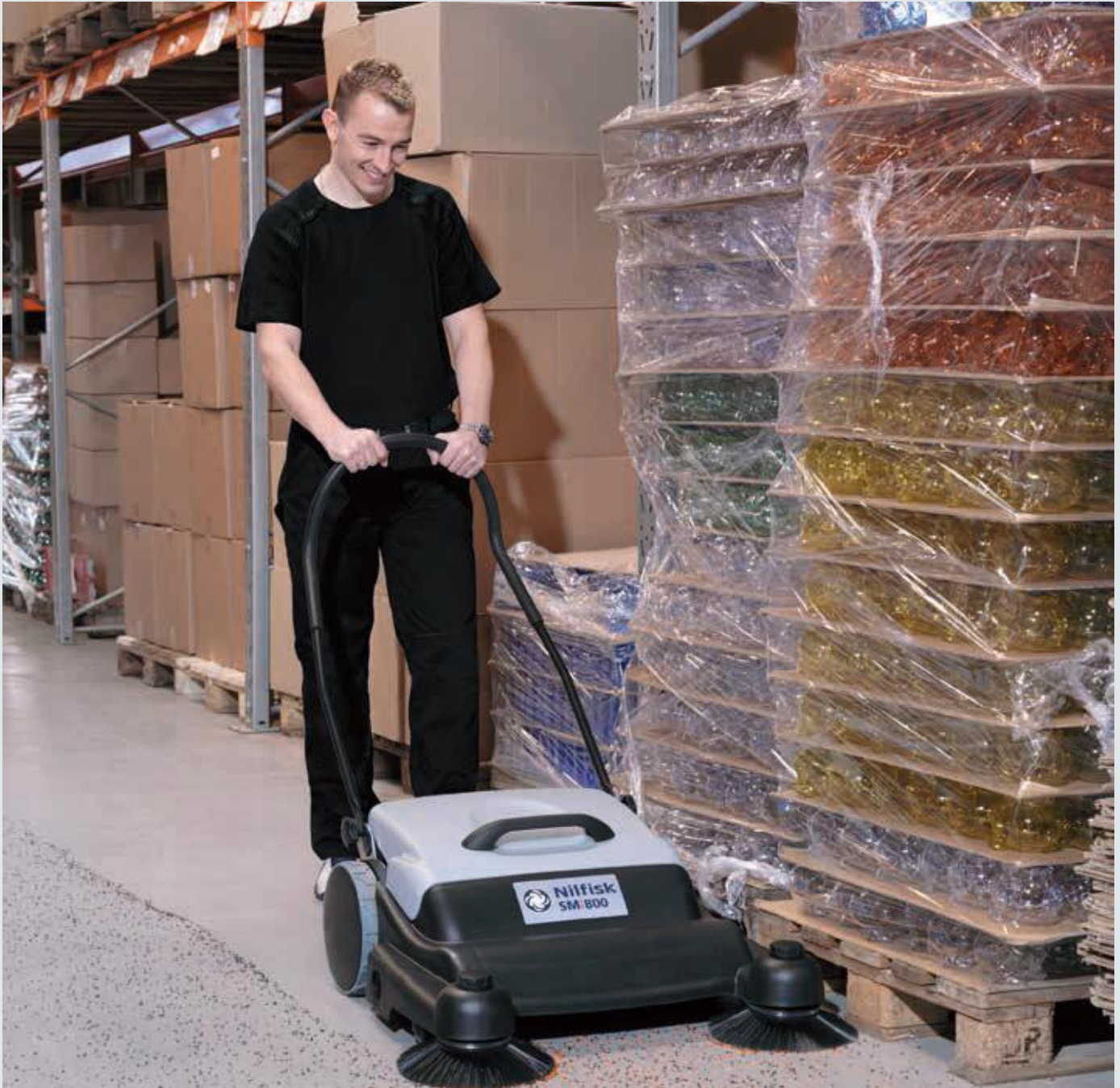
Der Schubbügel kann optimal auf die Größe des Bedieners angepasst werden (drei Positionen).