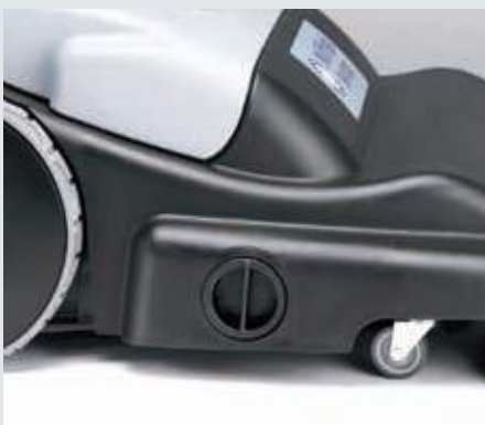
Hauptkehrwalzen einzeln und werkzeuglos in vier unterschiedliche Positionen einstellbar.