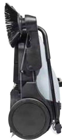
Der Kehrgutbehälter bleibt an Ort und Stelle, auch wenn die Kehrmaschine in einer aufrechten Position aufbewahrt oder an die Wand gehängt wird.