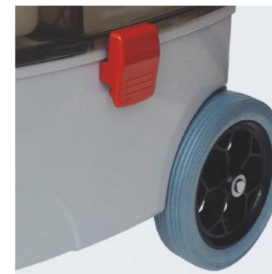
Große, gummierte Räder für spurloses Arbeiten auch auf empfindlichen Böden.