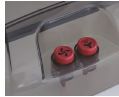
Sprüh- und Saugfunktion sind einzeln am Gerät zuschaltbar.