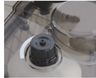
Ein separater Tank ermöglicht den Betrieb mit Entschäumer und garantiert damit ein kontinuierliches Arbeiten.