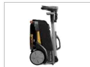
Transportierbar und leicht zu lagern