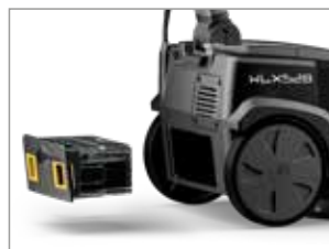
Lithium-Ionen- Batterietechnologie und schnelles Aufladen